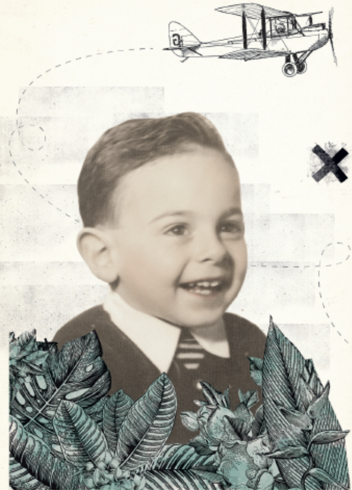
Nacido el 12 de mayo de 1950